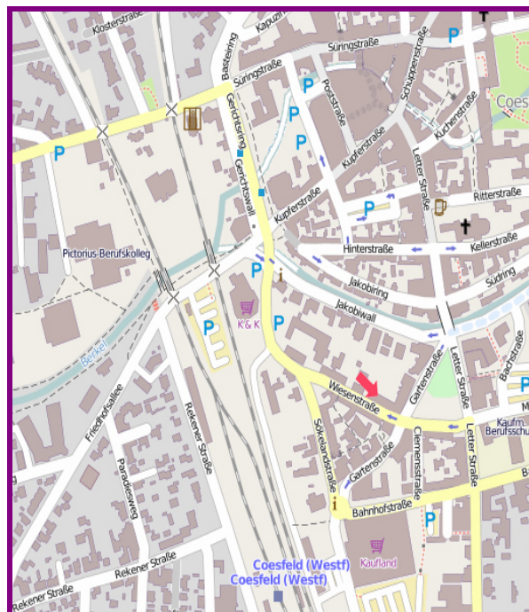
Stand März 2014

Paritätischer Wohlfahrtsverband (1. Obergeschoss) Wiesenstraße 14 48653 Coesfeld